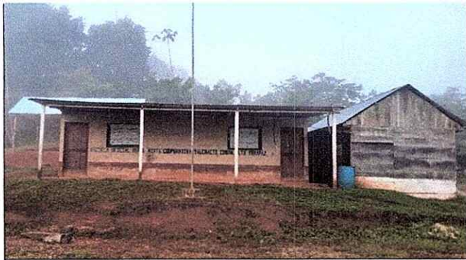
Foto1: Mantenimiento de Paredes, tratamiento con cernido