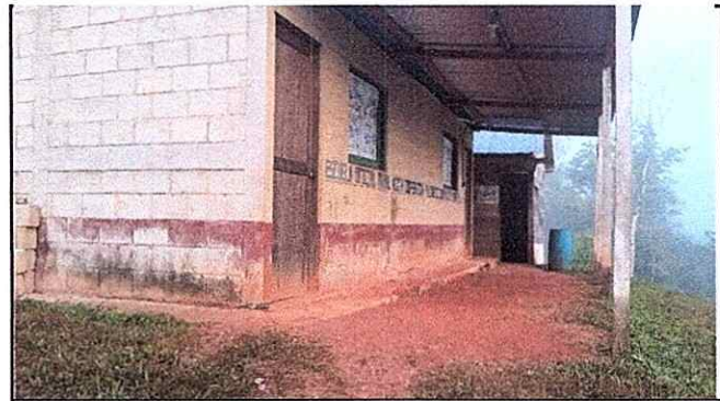
Foto 4: Cambio de Puerta y Ventanas. Fabricacion de Piso de Concreto.