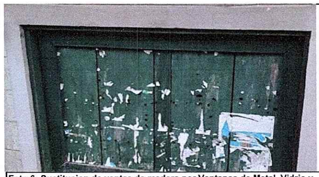
Foto 6: Sustitucion de ventas de madera por Ventanas de Metal, Vidrio y Balcon

Observación: Si es necesario se pueden agregar hojas adicionales y actualizar el número de hojas.